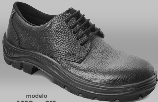
modelo 1010 ou 911