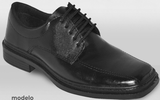
modelo 727 TRADICIONAL