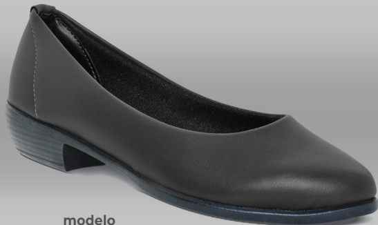
modelo 727 FEMME